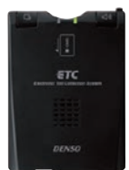
株式会社デンソー製 外部接続インターフェース付