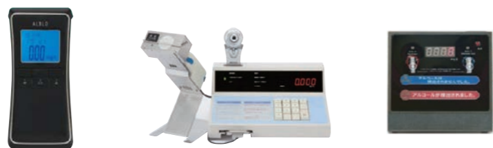
株式会社タニタ製 東海電子株式会社製 株式会社東洋マーク製作所製