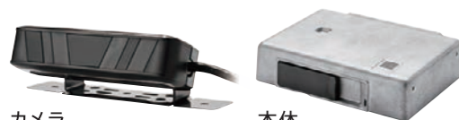
カメラ 本体 株式会社デンソー製

ドライバーの居眠り・脇見の検知結果を 日報に表記 DN-DSM ドライバーステータスマニター