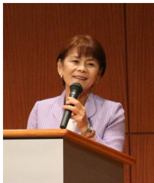
元女子ソフトボール日本代表監督 宇津木 妙子氏