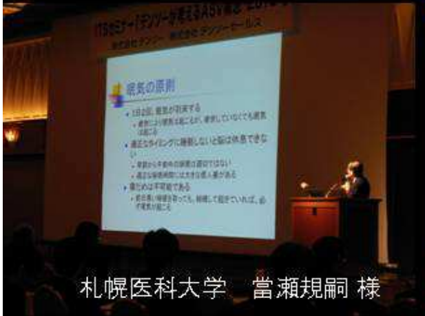
札幌医科大学 當瀬規嗣 様