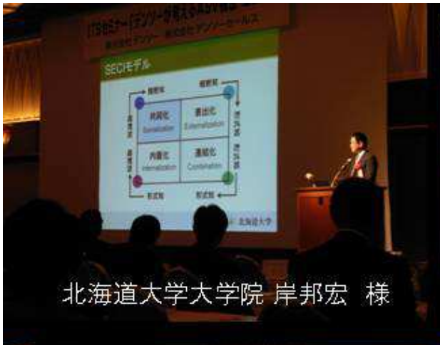
北海道大学大学院 岸邦宏 様