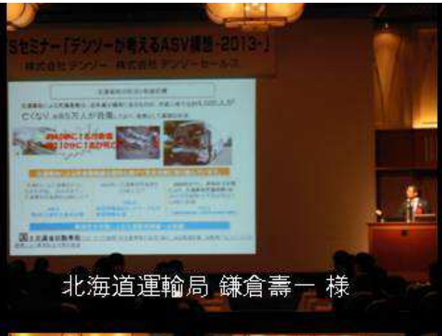
北海道運輸局 鎌倉壽一 様